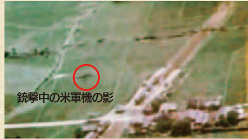
銃撃を受ける筑紫駅と下り電車 (米軍ガンカメラ映像より)

ため飛来したといわれ、搭載していたガンカメラの映像フィルムが米国国立公文書館に保存されており銃撃の生々しい状況が記録されています。機銃弾の弾痕が残る待合所が地元の熱意により保存され、現在は筑紫駅に近い「ふれあい公園」のなかに「平和祈念館」として整備し、毎年8月8日には平和記念行事が開催されています。