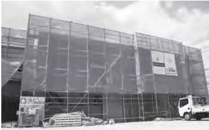
建設中の二日市東コミュニティセンター

二日市東地域におけるコミュニティ活動や生涯学習の拠点施設となる「二日市東コミュニティセンター」が開館します。新しい二日市東コミュニティセンターは、総面積1515・47平方メートルの2階建てで、大研修室、会議室、調理室、視聴覚室などの利用ができます。