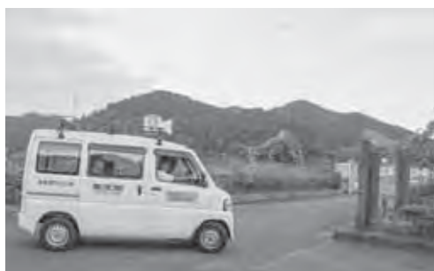
夜間のパトロールを行う青パト（山神ダム駐車場）