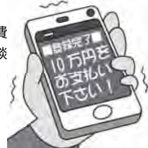
「消費者庁イラスト集より」

●消費生活センター相談専用電話 ☎(923)1741 (平日9時～11時45分、13時～16時30分)