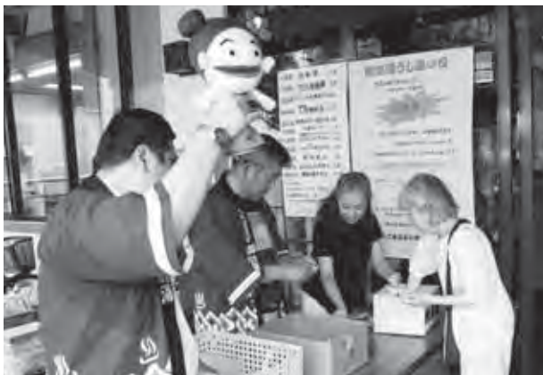
入浴客などに対し抽選会を開催しました