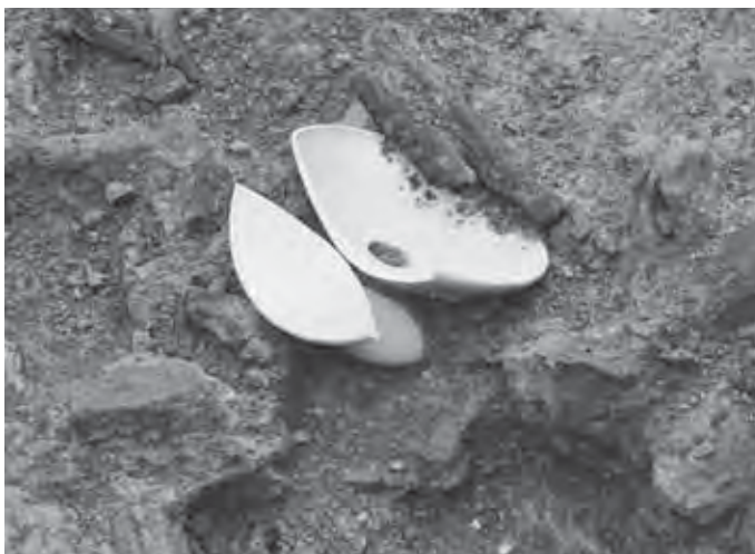
発見当時の堀池遺跡出土 青磁の唾壺

このことから、この墓の人物は古代大宰府に係する高位の役人と想定されますが、詳細はいまだ謎に包まれています。よみの世界にまで携えられた青磁の唾壺は、