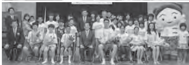
(上) キャンディーレイで歓迎 (下) 子ども大使とホストファミリー