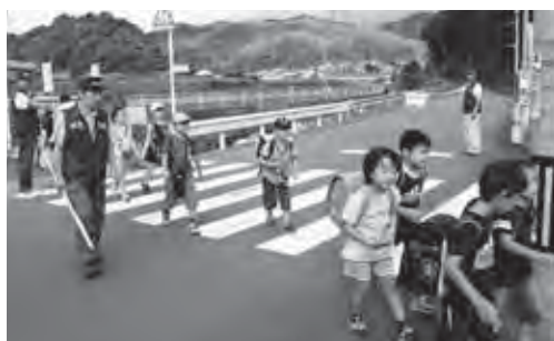
山口小学校まで子どもたちの見送りをしています