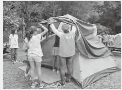
子ども育成連絡協議会子ども会in竜岩

子どもの家庭・地域での体験活動や社会参加・世代間交流などの情報提供、また、悩み相談体制の充実を図り、学習指導ボランティアなどの青少年指導者の確保・育成や青少年の健全育成を阻害する環境を浄化し、青少年の健全育成に努めます。