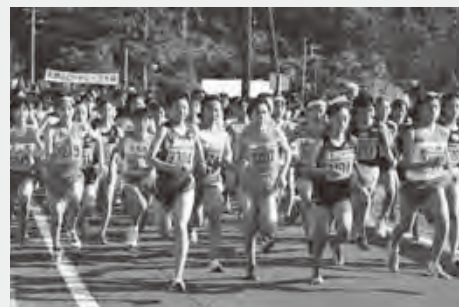
天拝山ロードレース大会

市民の年齢や体力に応じて、楽しみを知ることができるようなスポーツをする機会を提供し、指導者やボランティアの養成などに努め、スポーツ・レクリエーションを推進します。