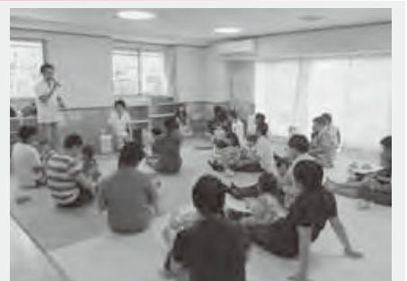
男性の子育て講座(育メン講座)

子育て家庭への生活支援、地域における子育て支援を行い、保育サービスの充実、就園の支援、母子保健の推進を図るなど子育て支援の推進に努めます。