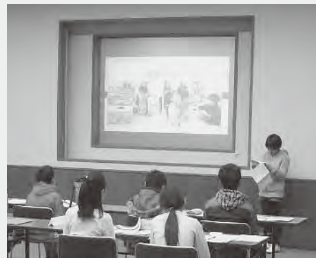
小学生読書リーダー養成講座

地域活動・学習活動への参加を推進し、人材育成・地域交流を高める教育活動の充実、また、知りたい学習情報が手軽に入手できるように生涯学習情報を共有化し、学習ニーズに応じた学習機会を充実させ、生涯学習・社会教育の推進に努めます。