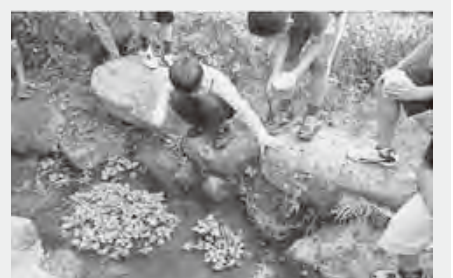
天拝虫まつり 虫幼虫放流

教育環境の整備、小中連携教育の推進、地域に根ざした教育の推進、教職員の資質の向上、コミュニティ・スクールの推進、就学の支援を行い、学校教育の充実に努めます。