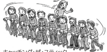
キャッチング・ザ・スティック