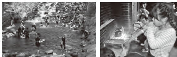
ファミリーキャンプのようす (写真左:みんなで川遊び 右:野外炊飯に挑戦中!)