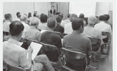
人権問題市民懇談会

市民・企業への人権意識の啓発、同和問題の解決や人権相談の充実を図るなど人権意識の向上に努めます。