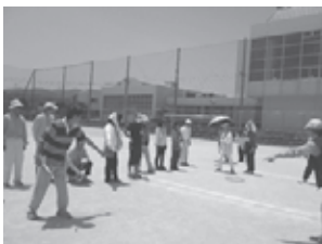
▲ニュースポーツ交流会