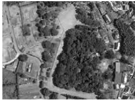
▲岩戸山古墳(前方後円墳、八女市)