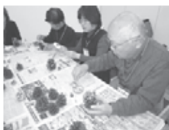
「このゆびとまれ♪」での学習活動のようす 写真左：しめ縄作り 右：まつぼっくりツリー作り