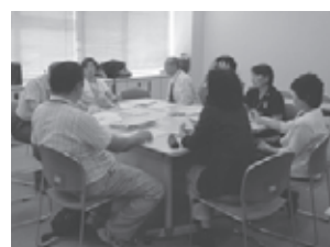
▲ボランティア派遣企画