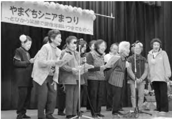
▲やまぐちサロン合唱団の皆さんは2曲を発表しました

やまぐちサロン合唱団の合唱発表と萩原区福祉委員による脳トレーニング体験の後、「笑いの健康」をテーマとした講演に、会場は皆さんの大きな笑い声に包まれていました。