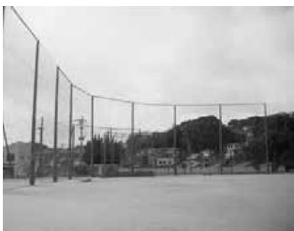
▲御笠運動広場防球ネット