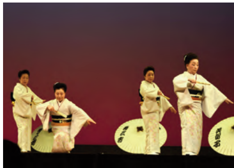
▲筑紫野市日本舞踊協会、芳柳寿々三蒼会の皆さん