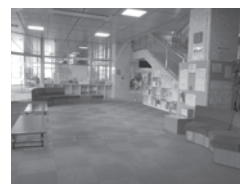
▲青少年プラザ内のようす