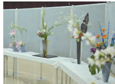
▲筑紫野市華道連盟の皆さんによる作品