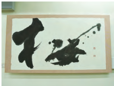
▲書道や絵画など多くの作品が展示