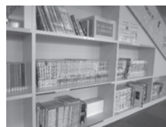
▲館外貸出ができる本(青少年向け約600冊)