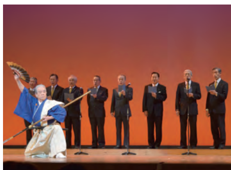
▲筑紫野市吟剣詩舞道連盟の皆さんによる吟剣詩舞

文化協会創立30周年および文化会館開館30周年の節目を飾る、各団体が披露する熱い演技の数々に、客席からは盛大な拍手と歓声が送られ、会場は大いに盛り上がりしました。