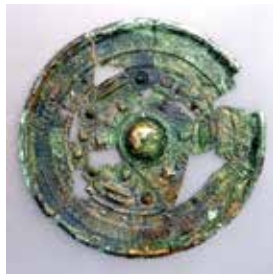
三角縁神獸鏡 (原口古墳出土)