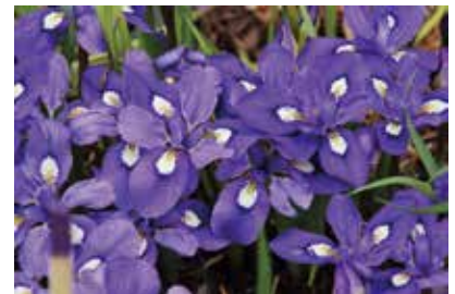
市指定天然記念物 平等寺エヒメアヤメ

市制施行50周年を記念して7月23日から夏の展示「筑紫野市のお宝もの」展を開催しますが、天然記念物などの展示できない本市の