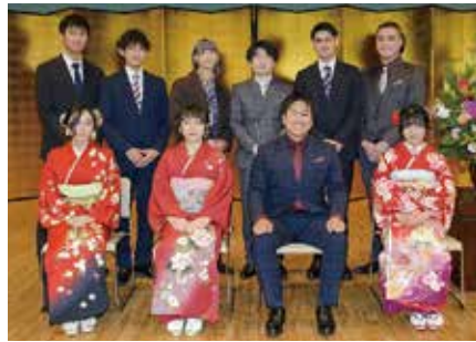
令和4年成人式実行委員の皆さん