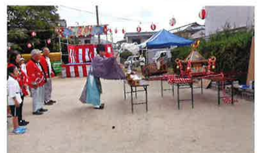
（7月 手作り子ども神輿 夏祭り）