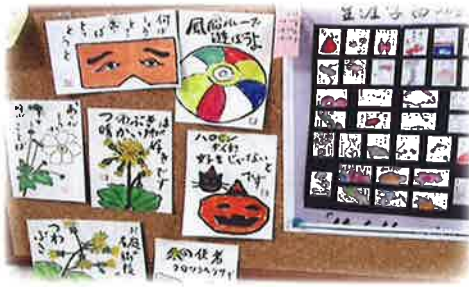
(サークル活動 絵手紙教室)