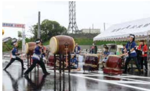
▲オープニングを飾ったつくし太鼓愛好会