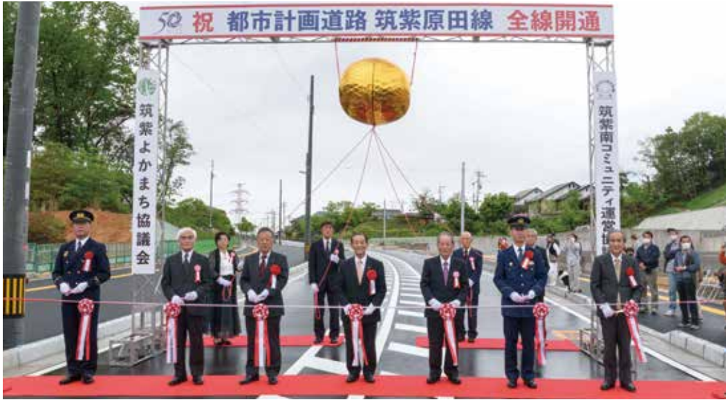
▲両コミュニティ協議会と来賓によるテープカット・くす玉割り