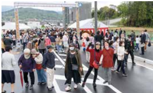
▲来場した皆さんによる通り初めが行われました