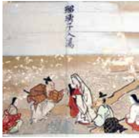
『武蔵寺縁起絵図』第三幅(武蔵寺所蔵)より瑠璃子入湯の図