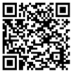
小児のワクチン接種 (市ホームページ)