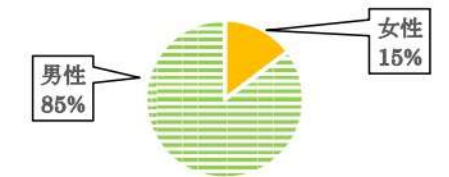
地域コミュニティにおける役員男女比