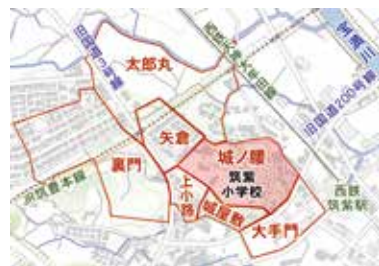
筑紫小学校付近の地名分布

賀県鳥栖市)を本拠として活躍した一族です。「城ノ腰」の位置は、想定される筑紫氏勢力圏の北端付近にあり、また、その北辺には宝満川が流れており、天然の要害であったと同時に、その最前線とも言える場所であったと考えられます。