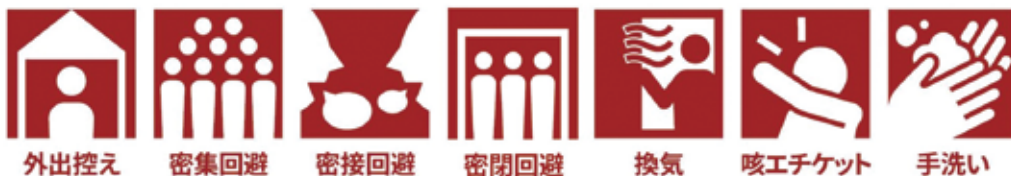
外出控え 密集回避 密接回避 密閉回避 換気 咳エチケット 手洗い