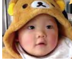
あんどう そう ま 安藤蒼真ちゃん(1歳)