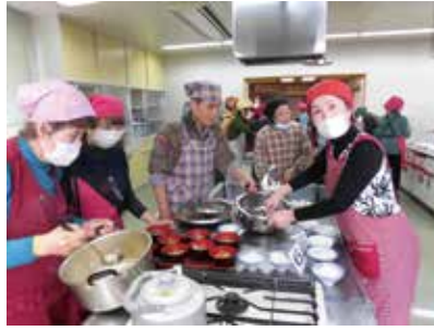
食生活改善推進員