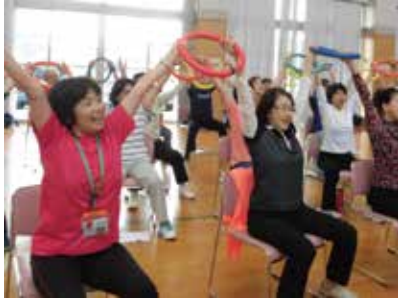
健康づくり運動サポーター