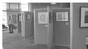
▲作品展示(絵画・紙版画等)

ちくしの高年大学とは、60歳以上の市民を対象にした市の主催事業です。生涯をととして続けられる生きがいを見つけるための学習の場を提供しています。平成26年度の募集は4月から開始します。詳細は「広報ちくしの」3月15日号もやいページでお知らせします。