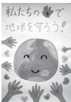
古賀 百恵 (筑紫東小学校6年)