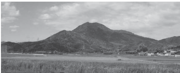
▲祭祀(さいし)が行われた宝満山(市内阿志岐からの眺望)