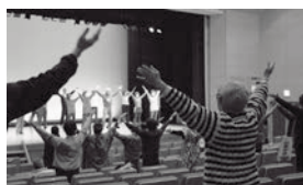
▲来場者と一緒に! (レクリエーション)