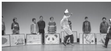
▲ガキ大将登場! (高年クラブ活動紹介)