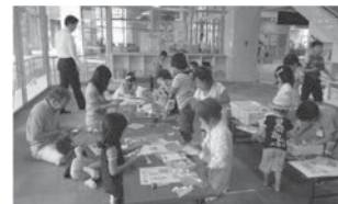
▲季節ごとのイベントのようす (七夕飾り作り)