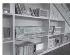
▲館外貸出ができる本 (青少年向け約600冊)