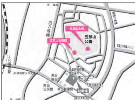
五郎山古墳館周辺地図