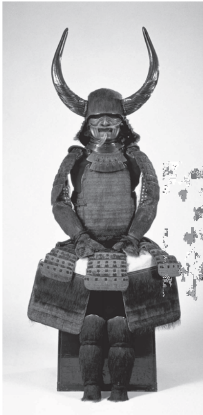
▲徳川家康所用「熊毛植黒糸威具足 (くまげうえくろいとおどしぐそく)」徳川美術館蔵

徳川御三家の筆頭である尾張徳川家は、徳川家康の九男 義直を初代とし、将軍家に次ぐ格式を誇る家柄でした。 その尾張徳川家ゆかりの道具類のうち、武器や茶・能・香道の道具や和歌や絵巻などの教養に関するものまで、徳川美術館に所蔵してある資料を展示します。今回の解説講座では、特別展の担当学芸員により、見所やワンポイントを解説します。 江戸時代の超有力大名家の道具とは、どれほどゴージャスなものなのでしょうか。