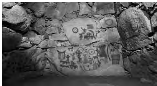
※壁画はCG(コンピューターグラフィックス)により加工したもの

問い合わせ先で電話番号を掲載していない課・担当などは、市役所本庁 ☎(923)1111をお願いします