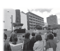
▲館外研修のようす