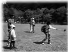
「えいっ！」 「ナイスショット」 (▲グラウンドゴルフ)