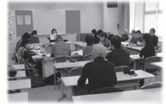
▲昨年の学習のようす