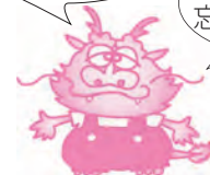
竜岩自然の家 マスコットキャラクター 竜岩ゴンザエモン