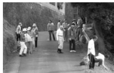
昨年のごみゼロ運動の様子

清掃したごみを入れる袋が不足する場合は、環境衛生推進員を通じて市まで連絡ください。