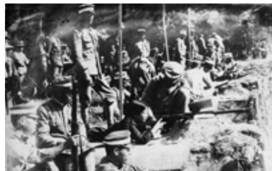
写真は女子青年団の射撃訓練(1935年)