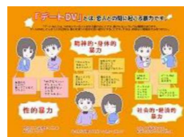
《デートDV防止啓発リーフレット》