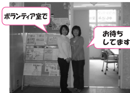
ボランティア室で

ボランティアに興味のある方ならどなたでもどうぞ。一度、ボランティア室をのぞいてみませんか。