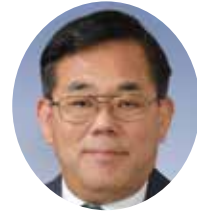
宮崎 吉弘 (公明党)

議員 遺族の方から、行政手続きがとても大変だった、もう少し円滑に手続きが出来たら良かったとの声を伺った。今後増加が見込まれる死亡・相続等の手続きは、より効率を求められるのではないかと。「おくやみコーナー」等窓口を設置し取り組む事例が増えているが。