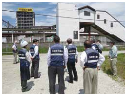
JR二日市駅西側改札口の設置工事が予定されている現地で、説明を受け内容を確認しました。