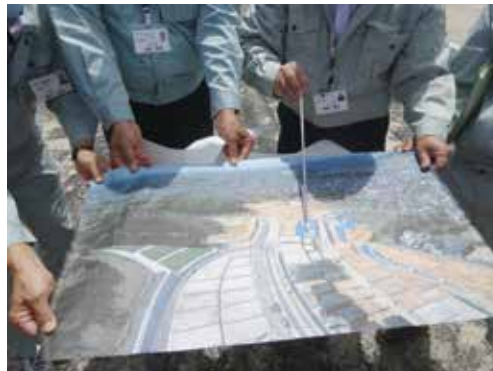
筑紫駅西口の宅地造成工事が美しが丘北から筑紫駅へ向かうメイン道路の工事の進捗状況を現地で確認しました。