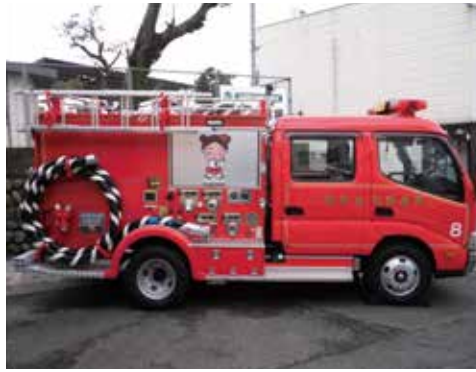
※写真は購入する車両のイメージです。