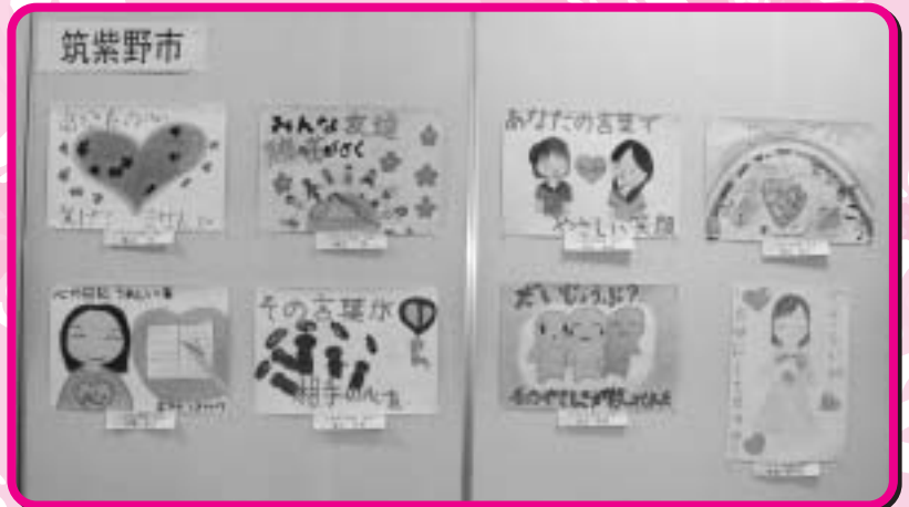
人権週間には市内の公共施設で人権標語図画が展示されます

人権擁護委員制度創設も60周年。人権イメージキャラクターと共に人権意識の普及高揚のために活動しています。