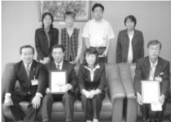
【今回認定された事業所】