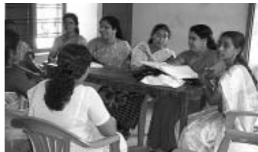
村のジェンダー問題処理委員