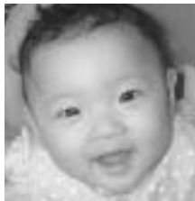
波多伊吹ちゃん 1歳 (11月17日生まれ) 塔原東