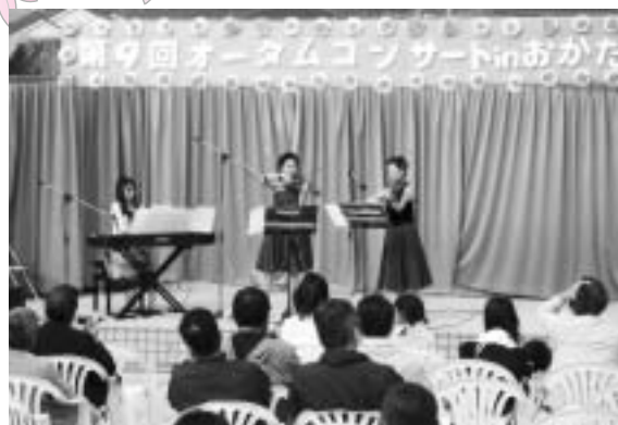
昨年開催時の様子