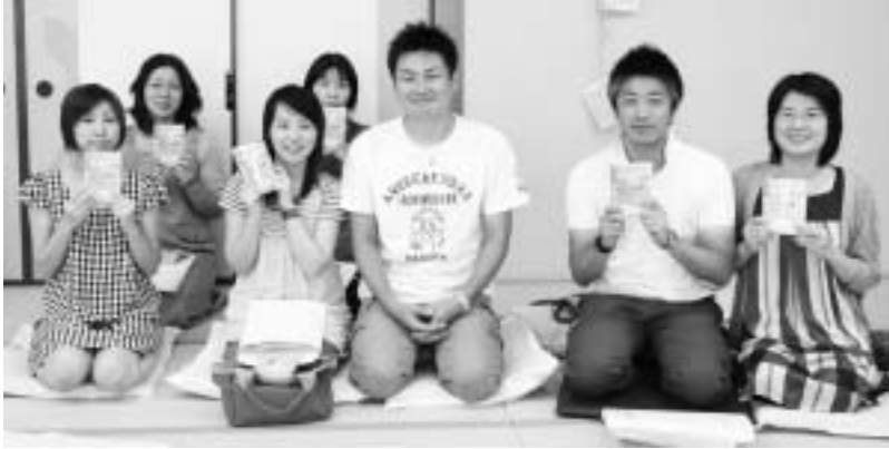
【妊婦健診受診票交付会日程表】