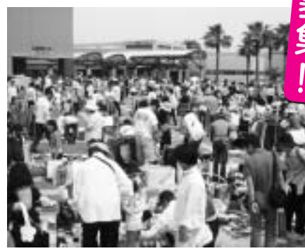
前回、開催時の様子

申し込み方法 ハガキもしくは封書に、「氏名(団体)の場合は代表者名」、住所、電話番号、出店品目の概要」を記載して事務局まで送付してください。詳細な内容を記載した文書を送付します。なお、申し込み多数の場合は抽選会を開催します。