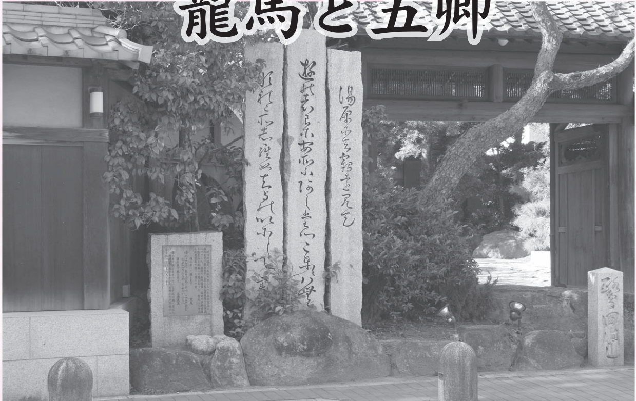
湯町の通りに建つ三条実美(さんじょうさねとみ=五卿の一人)の歌碑