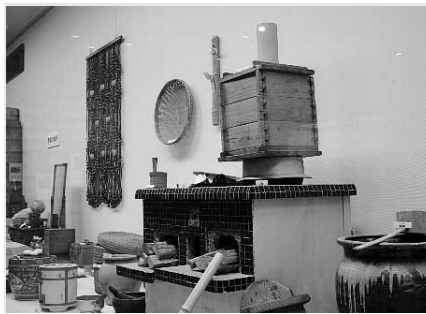
「くど」と「羽釜」 【昨年度の展示より】