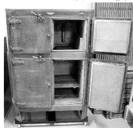
冷蔵庫(業務用サイズ)

蚊帳、火鉢、電話交換器、鉄砲風呂、黒電話、水冷蔵庫、柱時計、筑紫野の古写真、学校の机、昔の遊び道具