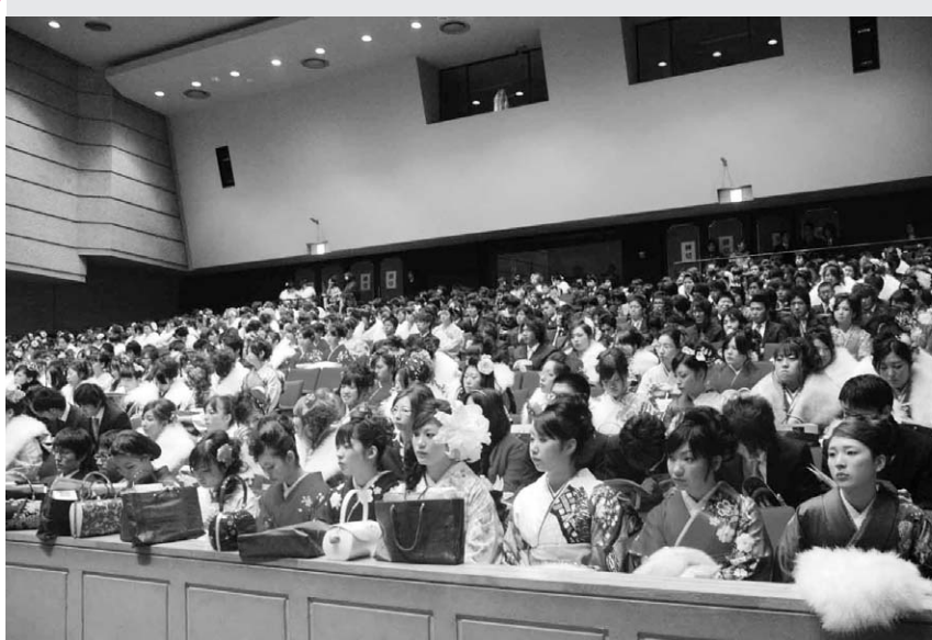
昨年開催時の様子