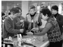
毛糸あそび学習会

ちくし笛かなで隊、エコクラフト、読み聞かせ、レクリエーション、毛糸あそび、手品、昔遊びなど