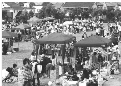
昨年、開催時の様子