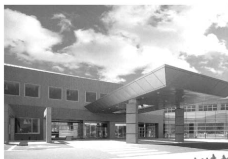
総合保健福祉センター 「カミリーヤ」