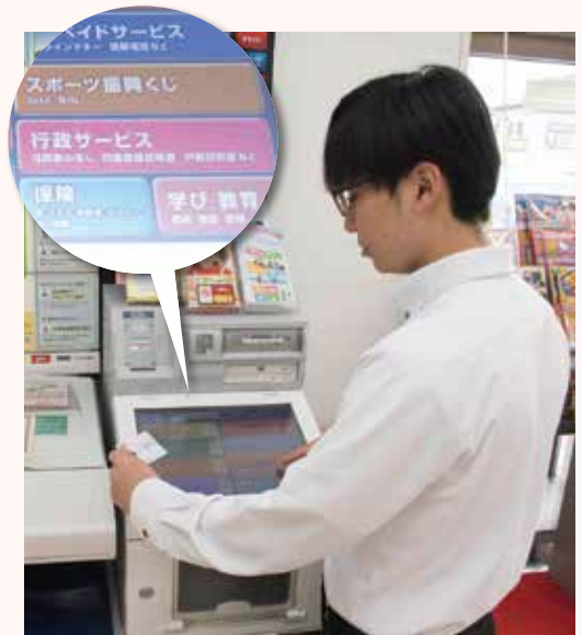
画面はコンビニエンスストアによって異なります