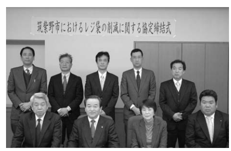
筑紫野市におけるレジ袋の削減に関する協定締結式

平原市長、筑紫野市ごみ減量推進連絡協議会森田会長、協定締結事業者の代表者もしくは代理出席者