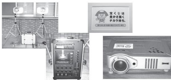
屋外放送機器(CD使用可)6台 プロジェクター 4台