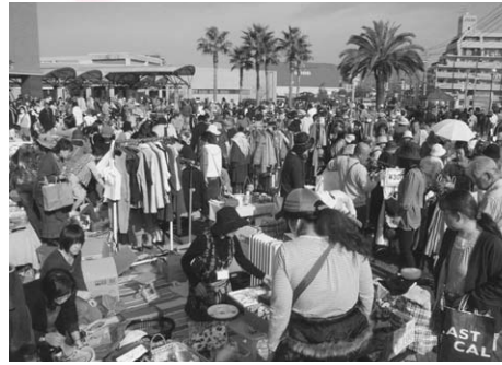
前回、開催時の様子