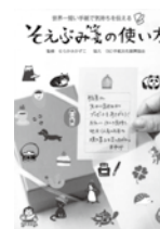
そえぶみ箋の使い方