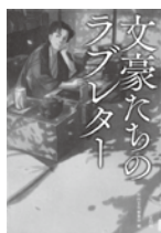
文豪たちのラブレター