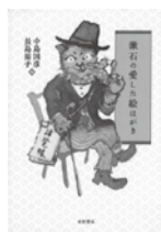
漱石の愛した絵はがき