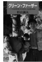
グリーン・ファーザー