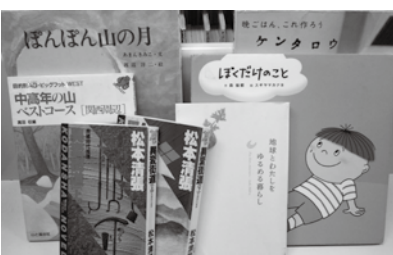
リサイクル本の一部

※持ち帰り冊数に制限はありませんが、多くの人が利用できるよう配慮してください。また、持ち帰るための袋などは持参してください。