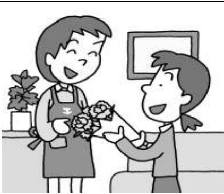
向こう三軒 両隣り