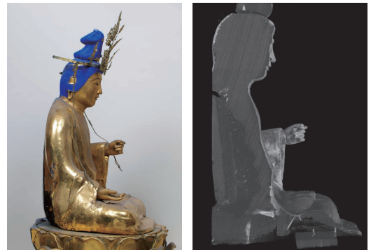
側面(左)と側面X線CT画像(右)

ここで柚須原観音堂に戻ると、ここに祀られてきた観音像は、まるで最近造像されたかのように光を放っていて、一見すると、とても南北朝時代の銘文をもつようには見えません。とはいえ、記録にある古像は失われたのだ、などと決めてしまう前に、今に伝わる像について、きちんと調査と検討をする必要があります。この時に意識すべきは、当初の姿です。というのも、仏像は造られた時のまま現在に伝わっているものではなく、とくに表面は、色が褪せたり剥落したりすると、新しく塗り直されるのが昔は普通だったからです。像高51.3cmのこの像について見てみると、聖なる体から放たれる光の表現である金色が、修理で新しく改められているだけではなく、その修理の際に目や眉が描き直されたりしていることも、随分印象を変えているようです。