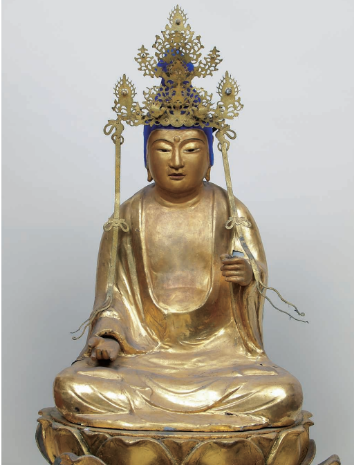
柚須原の聖観音坐像(筑紫野市指定有形文化財)

宝満山の肩越しに今も筑紫野市と飯塚市を結んでいて、古来交通の要所である米ノ山峠のすぐ近く、柚須原の集落の中に、柚須原観音堂は所在しています。大山祇神社と隣り合って佇むこのお堂の中心には、つい最近まで、金色に輝く聖観音坐像が祀られていました。