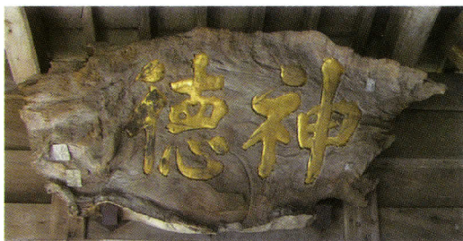
大楠の一部でできた山家宝満宮拝殿の扁額