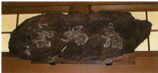
民家に伝わる楠材の扁額