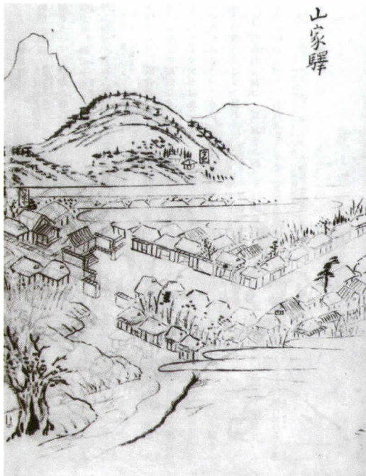
『筑前名所図会』にみえる大楠(左はし)