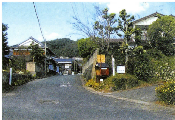
▲現在の表御門付近