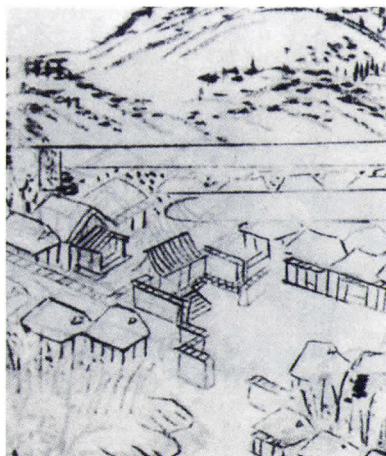
▲『筑前名所図会』にある山家の御茶屋

御茶屋の敷地には、腰掛、厩、御道具藏、井戸、池があり、番所が三ヶ所あって御茶屋を警護していました。御茶屋は、街道よりも高台に建てられており、御茶屋のまわりには下代の屋敷が建ち並び、御茶屋の裏門は、代官所や下代屋敷に通じていました。