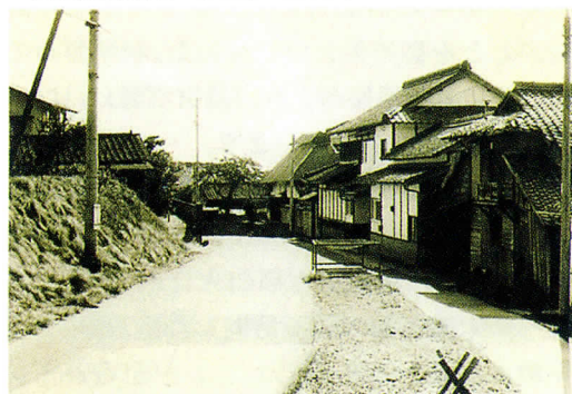
▲御茶屋跡から見た下代屋敷 右側に見えるのが江戸時代の道です。(撮影 昭和50年頃)