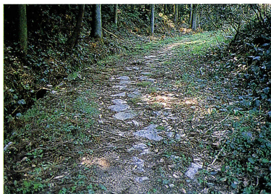
長崎街道の石畳(筑穂町)