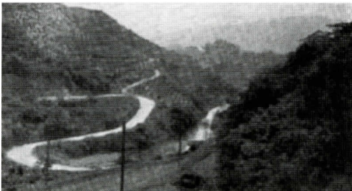
冷水峠付近の旧長崎街道（撮影年代：昭和初期）

シーボルト事件がおきる半年ほど前、文政11年3月、福岡藩主黒田斉清が養子の斉溥をつれてシーボルトを長崎のオランダ商館に訪