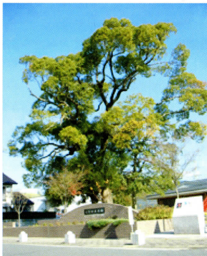
旧長崎街道付近の大楠(筑紫野市下見くすの木公園)

われわれが泊まった山家で、われわれはまもなくこの土地の珍しい物を見つけた。中にはとくに珍しい鉱物のコレクションがあつて