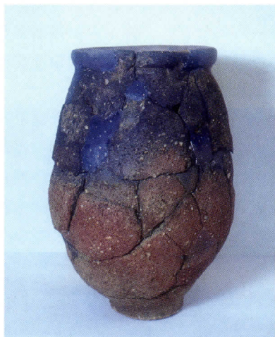
図1 朝鮮系の後期無文土器 （隈・西小田遺跡出土）

朝鮮の後期無文土器の甕は、口に貼りつけた粘土帯の断面が円形の水石里式（前半）と（図2）、三角形の勒島式（後半）にわかれ、本例は水石里式に属します。