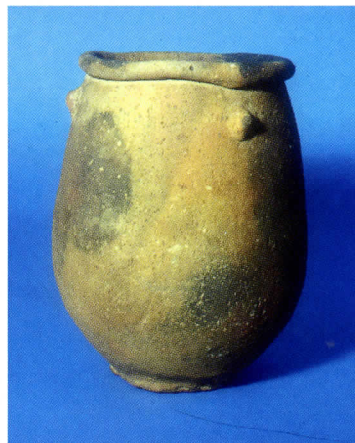
図2 水石里式の後期無土器 （伝忠清南道懷徳出土）

朝鮮系の後期無文土器が、はじめてまとまって確認されたのは、1974年の福岡市博多区諸岡遺跡の発掘でした。ここでは搬入品あるいは忠実に再現された水石里式の無文土器が、集落の一角に設けられた弥生時代前期末の土坑18基のうち12基から、50点以上も出土しました（図3）。この地区で発見された弥生土器はわずか30点で無文土器より少なく、無文土器は主要な器種がそろうこと、しかし石器はほとんど無く、土坑に焼土はあるが短期間にほぼ同時に使われたことなどから、無文土器人の集団が一時的に居住した遺跡とみられます。