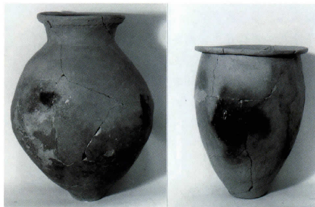
図4 勸島遺跡の擬弥生土器（城ノ越～須玖Ⅰ式系）