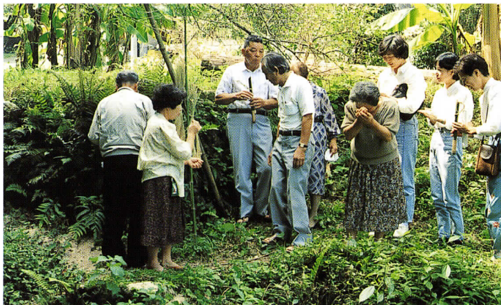
▲山口地区古賀のダブリュー（平成5年9月）

時期は田植え前（旧暦4月、5月）に行うところとその後に行う地域がありました。戦後も一時期まで市内のほとんどの地区で開かれていた農村の純朴な祭事ですが、記念碑があるのは馬市だけです。現在では牛馬の姿を見ることはありません。