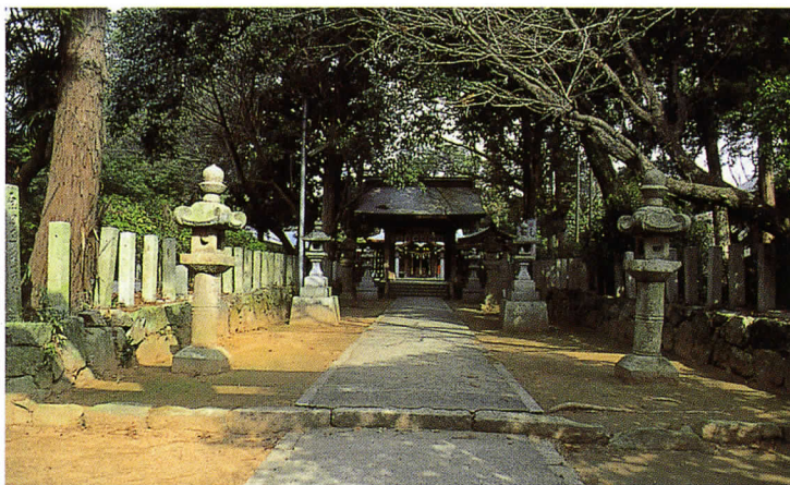
▲筑紫神社の参道。左側に記念碑がある。

郎は「三国峠開削費用」についての願書を、福岡県令や御笠郡長に提出しています。工事が難航したのか、経費の一部に当時の金で151円を自ら寄付し、ほかに地元からの寄付も加えようやく開通させました。1889年（同22）末に九州鉄道（現JR鹿児島本線）が開通、昭和初期には国道も開通して原田は文字通り交通の要衝となり、経済動脈としての役割も高まりました。この