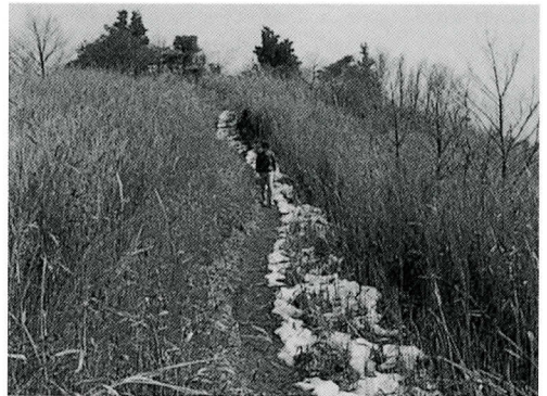
▲ 大根地山頂上付近