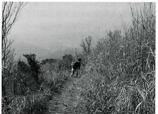
▲ 山頂付近からのながめ