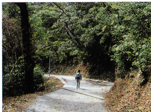
▲ 登山路 照葉樹の林と登山路

この山の山頂には大根地神社・稲荷大明神が祭られ、昔から信仰の山として崇められてきましたが、最近は登山路が整備されたことにより森林の散策と頂上からの展望を求めるハイカーの手頃な山となって賑わいをみせています。