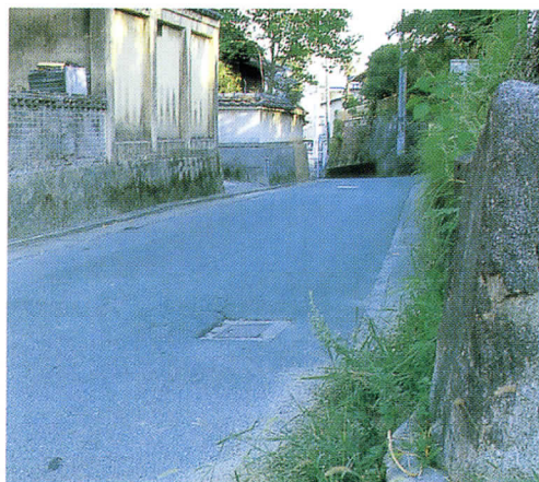
一揆が通過した道（太宰府市大字南～筑紫野市大字二日市）

東から来た一揆は、福岡城へと入り、官舎を焼き、県庁を打ち壊した。県には収拾する能力がなく、政府はついに陸海軍を鎮