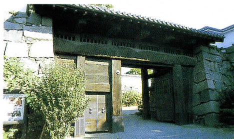
福岡城大手門には今も竹槍で突かれた跡が残る

これをきっかけに、筑前全域を舞台に2週間近くに及んだ筑前竹槍一揆が起こるのである。きっかけは金国山の出来事に過ぎなかったが、一揆が筑前全域へと広がったのは、底流として民衆の間に政府への強い不満があっ