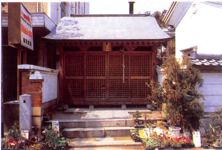
◀本町のえびす神(下えびす)