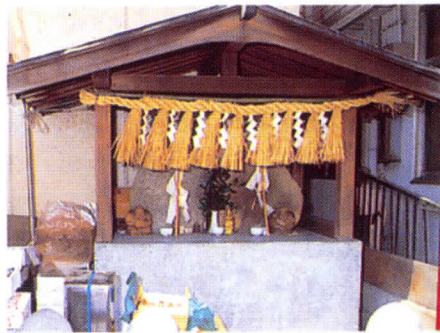
▼中町のえびす神(上えびす/現存しない)