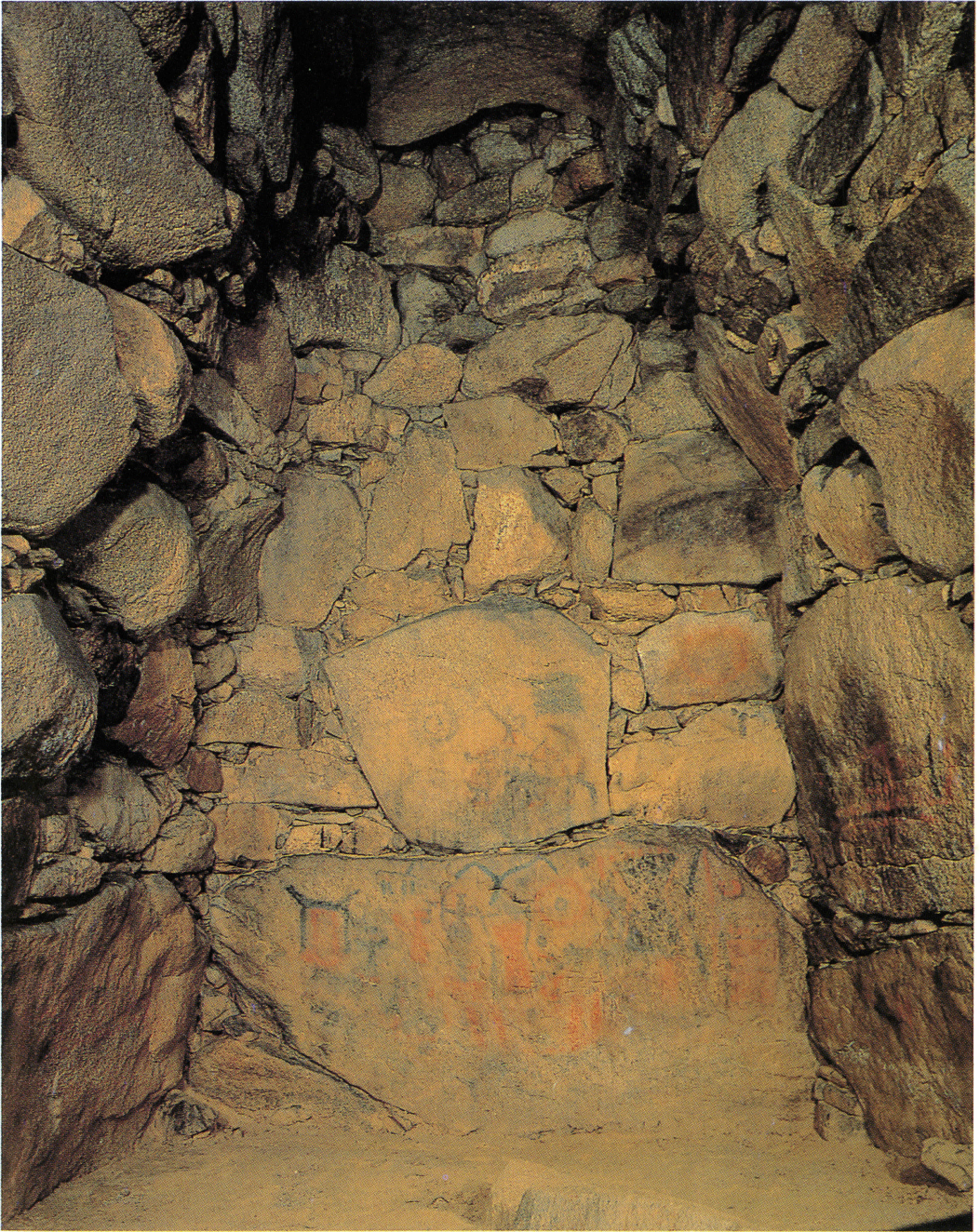
五郎山古墳石室の奥壁に描かれた壁画