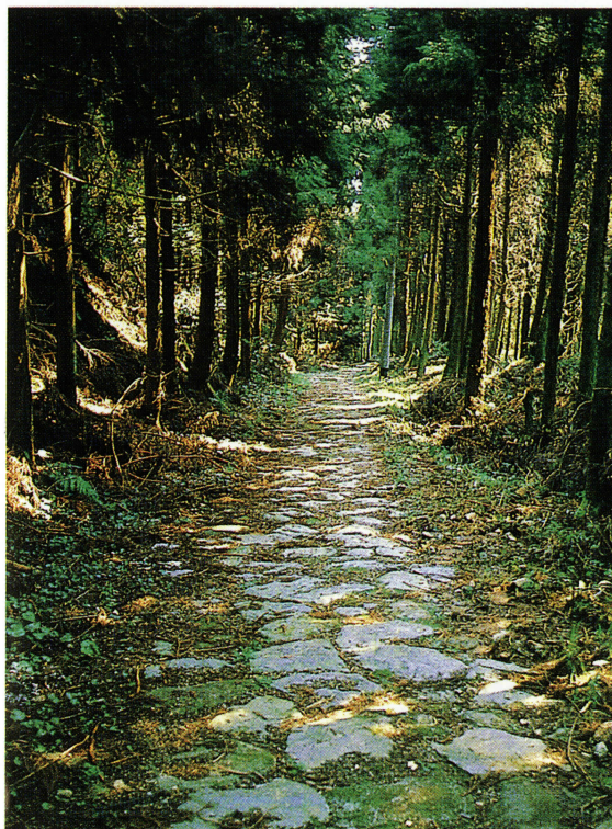
▲内野宿から冷水峠へ向かう長崎街道。まだ石畳が残っています。江戸から長崎・薩摩へと歩いた人々の足跡がうかがえそうです。