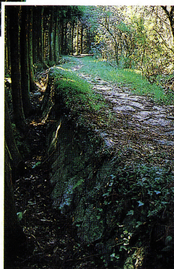
▶部分的に当時の道幅を完全にとどめているところもあります。

現代とちがって、江戸時代の街道は幕府と大名のためのものでした。幕府の役人には、一年交替で勤務する長崎奉行と日田郡代その他があり、大名には薩摩の島津氏を筆頭に、九州すべてで35の大名が一年は在国、一年は江戸と、参勤交代のあわただしい毎年を繰り返しました。そのために整備されたのが街道と宿場です。