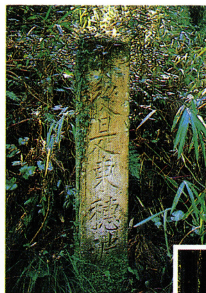
◀旧冷水峠に立つ「従是東穂波郡」の郡境石。西が御笠郡になります。