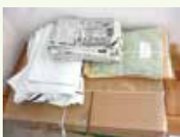
▲ごみの分別も立派なデコ活