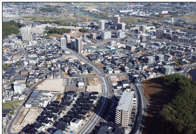
上空からみた西鉄筑紫駅西口地区の現在の地勢

令和6年3月末日をもって区画整理課は40年に及ぶ歴史に幕を下ろしますが、4月からは都市計画課が事務を継承し事業完了へ取り組んでまいりますので、変わらぬご理解とご協力をお願い申し上げます。