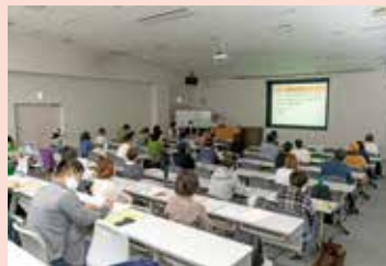
▲多くの登録希望者が参加します