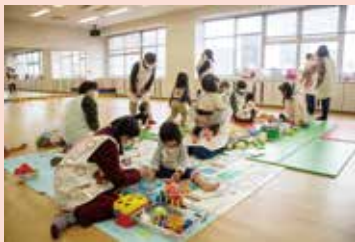
▲託児はまかせて会員にまかせて

また、学習会中は託児を無料で受けていますので、託児を希望する人は早めに予約をお願いします。