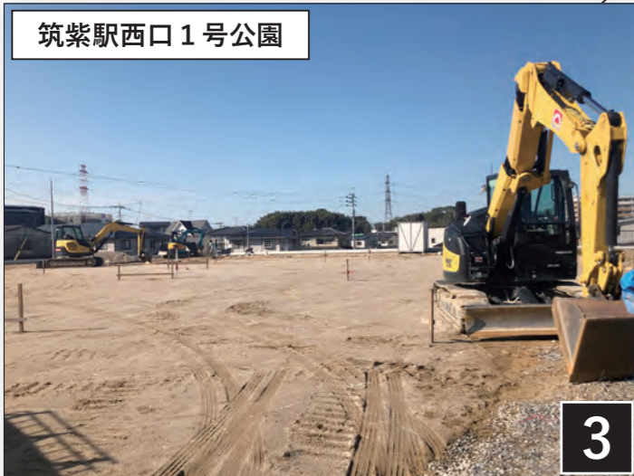
筑紫駅西口1号公園

移転後は、整然とした墓地に生まれ変わりました。また、駐車スペースも設けられており利便性が高まりました。