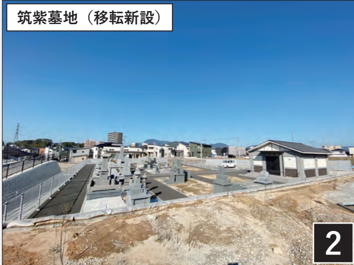
筑紫墓地（移転新設）

区画整理事務所が市役所新庁舎に移転した後に造成工事を行い、昨年秋に使用収益を開始しました。