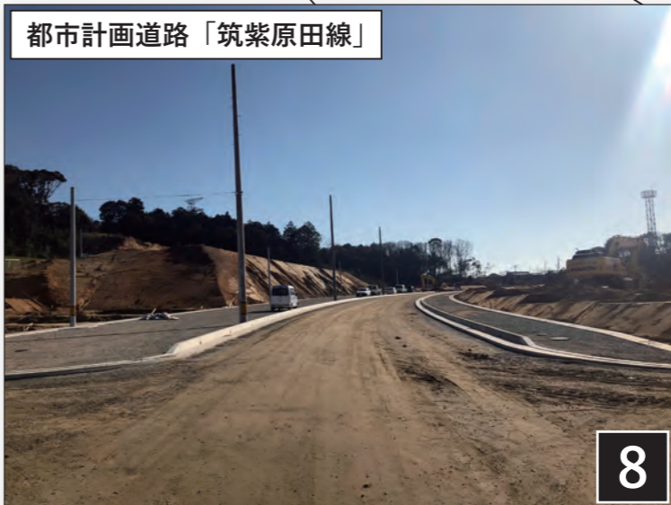
都市計画道路「筑紫原田線」

隣接する山林の法面を緩やかにし、日当たりを確保するとともに高低差を緩和しています。