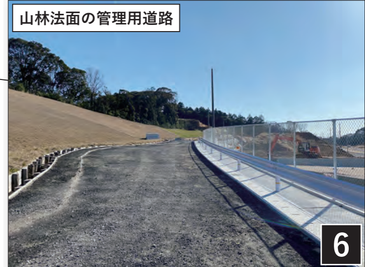
山林法面の管理用道路

宅地は道路や隣地との高低差に応じて、敷地境を土羽で仕上げたり、ブロック塀で仕上げたりします。