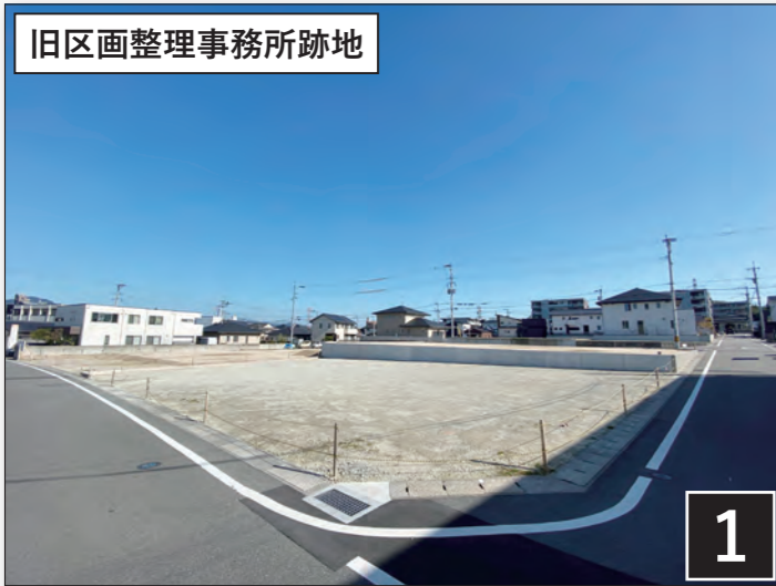
旧区画整理事務所跡地