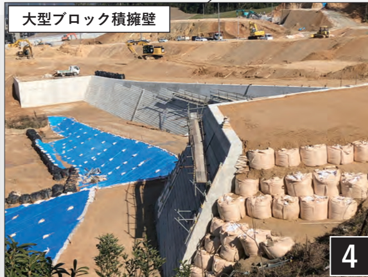
大型ブロック積擁壁

西口エリアで4つ整備される公園のうち2番目に広い公園です。広場を多く設定しているのが特徴です。