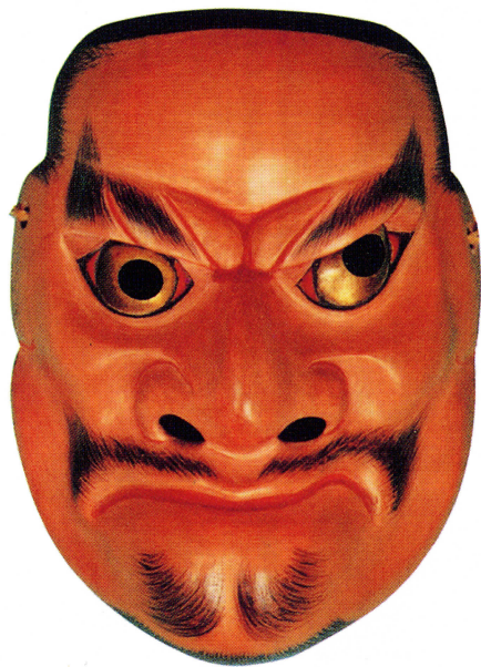
すきのおのみこと 神楽面 素蓋鳴尊