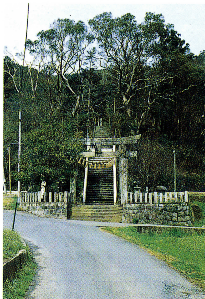
▲黒田藩も神殿、神楽殿などの再建にかかわった山家宝満宮

江戸時代の長崎街道「筑前六宿」の山家（市内大字山家）は『筑前国統風土記』に「東西の通路にて、宿駅なり。町あり、国君の行館あり。民家多し。又博多より二日市を經、甘木に行き、筑後豊後へ通る。南北の大道も、此宿の少西にあり。」と繁栄ぶりを伝えています。