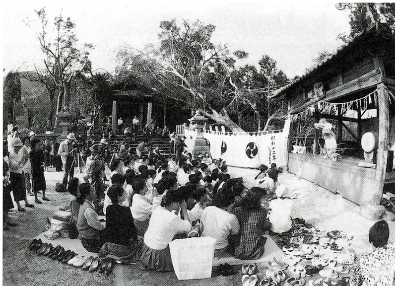
▲毎年10月17日の神楽奉納には、境内の参拝者が多い